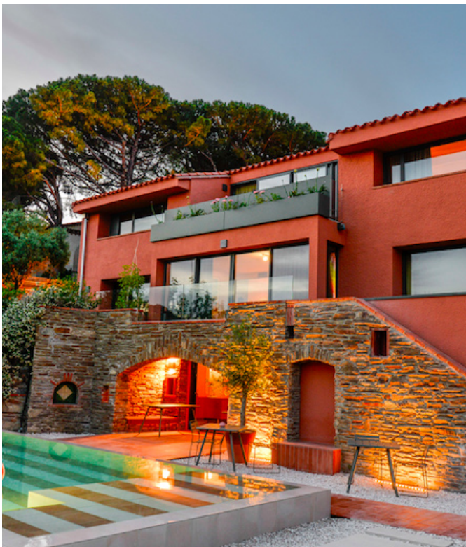
La Maison Nova à Collioures