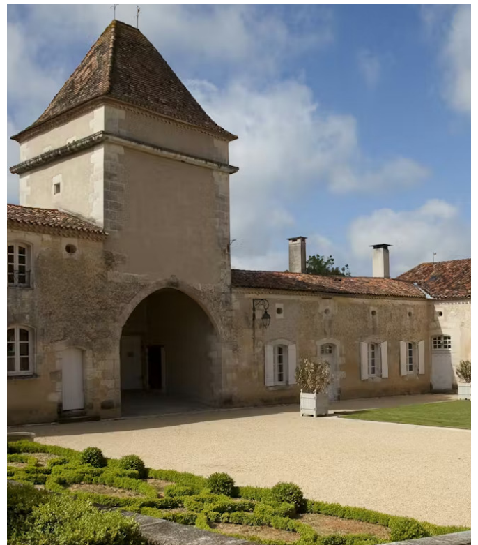
Château de Saint-Privat-des-Prés