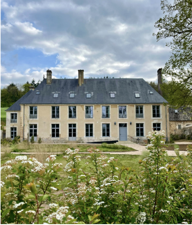
L'hôtel LES PRÉS dans le Perche